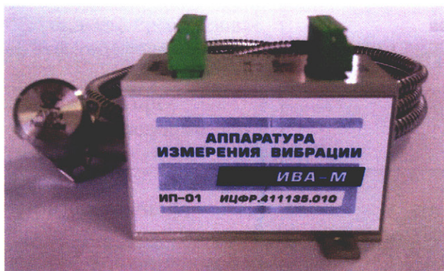
Рисунок 2 – Фотография общего вида ИВА-М